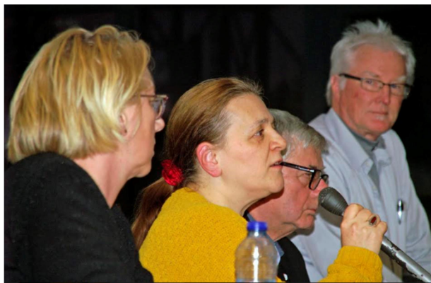
Politiek debat tussen TROTS, SP en OPH raadsleden

Het politieke forum zorgde voor een stevige discussie over de relatie gemeente – provincie, de nieuwe democratie en nieuwe bouwplannen in de wijk de Krim.