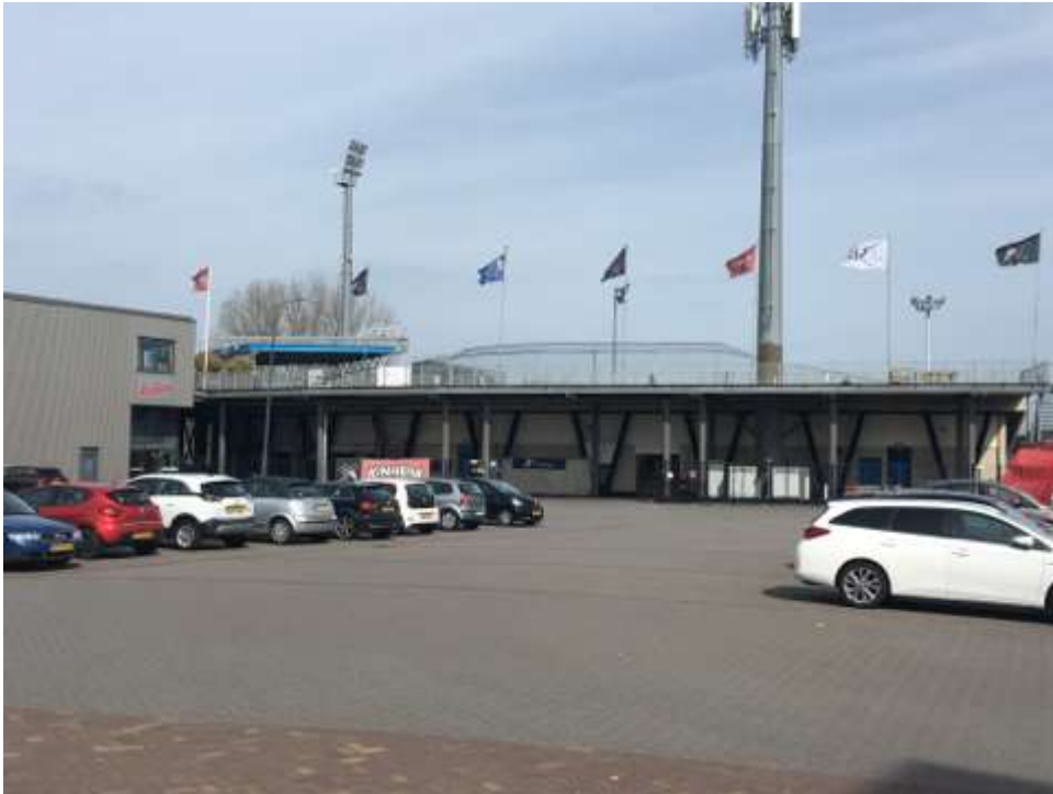
De plek waar de turnhal gebouwd moet worden.

We blijven dit proces kritisch volgen en hebben inmiddels ook vragen aan het college gesteld over de afmetingen van de hal en of dit nog in het bestemmingsplan past.